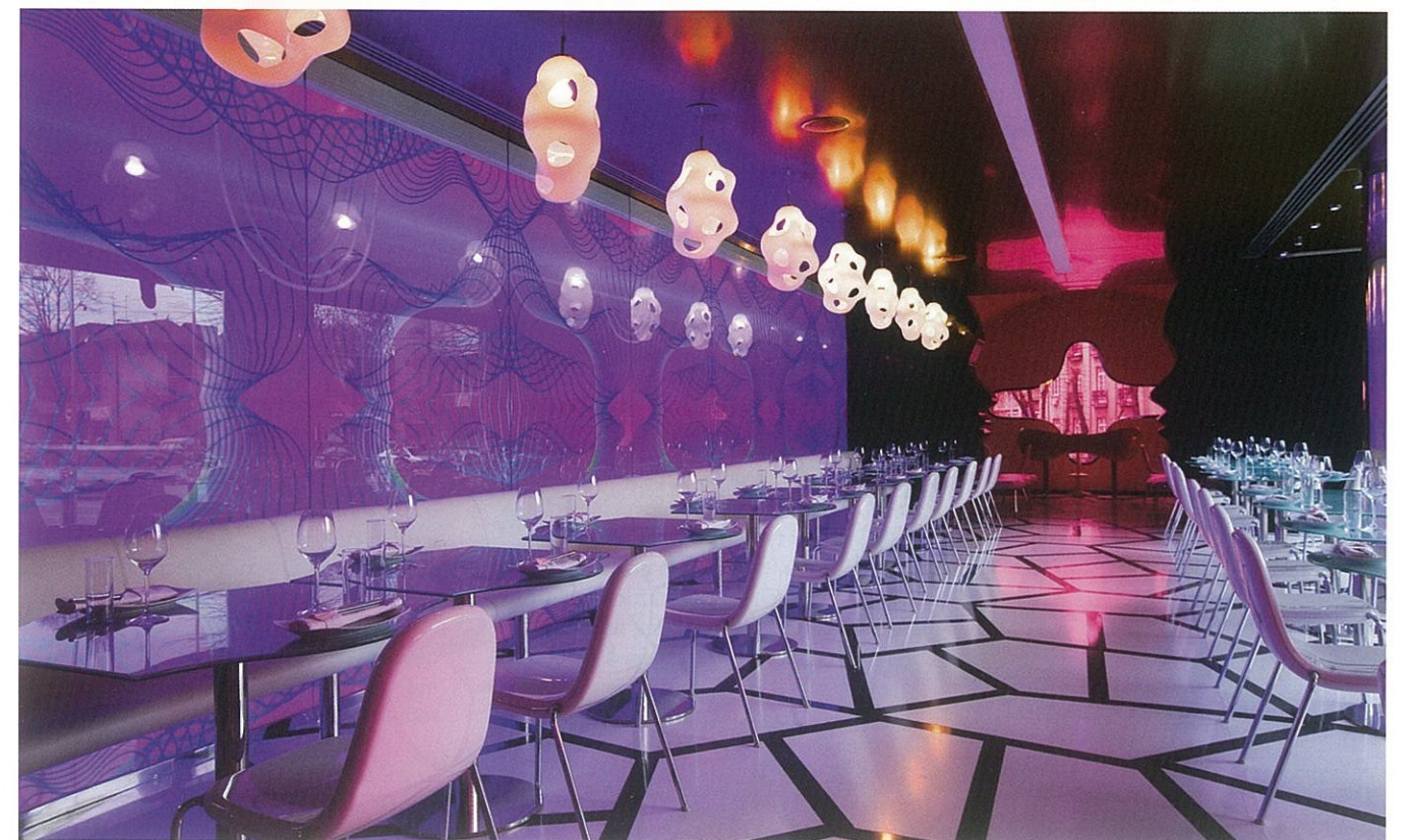
Majik Café, Belehrad

V reštaurácii sa spája Karimova záľuba v zmyselných líniách a farbách a vo vytváraní dynamizujúceho priestoru. Atmosféra sa tu preniesla do 21. (techno)storočia, čomu napovedá oznamovací LED displej textových správ pre zákazníkov. Techno-organické sa však spája s humánno-organickým, napr. v podobe mužského a ženského profilu, ktoré tvoria vstup do diváckej klubovne. V modernom interiéri ožívajú srbské motívy prostredníctvom ikonicky tvarovaných okien či starej dekoratívnej vzorky, a vytvárajú tak kaleidoskopický inšpiratívny priestor na oddych, zábavu, dobré jedlo a pitie.