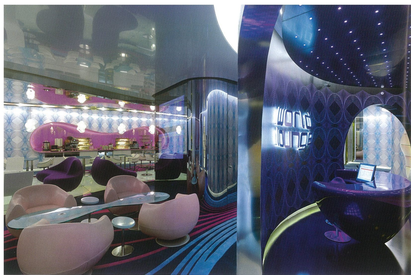
World Lounge, medzinárodné letisko v Istanbulu

Letiská sú charakteristické všadeprítomným paradoxom vzrušenia a energie z cestovania a vlečúceho sa čakania. Rashida táto dvojnásobnosť inšpirovala k vytvoreniu priestoru, ktorý zintenzifikuje cestovateľský zážitok a súčasne poskytne zotavenie tela aj duše.