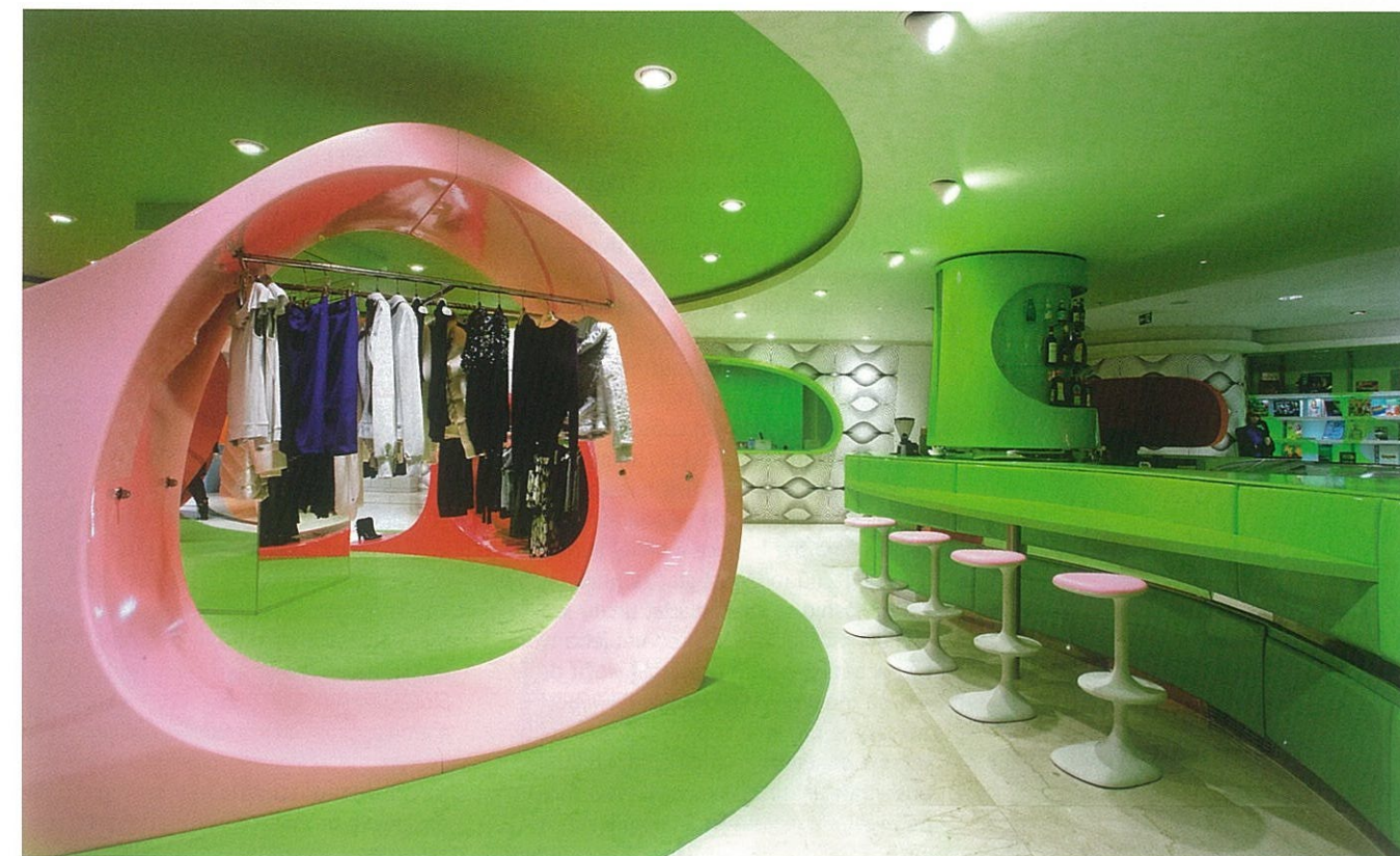
Obchod Bosco Pi, shopping centrum Vesna v Moskve Techno-organickej fluidnej atmosfére dominuje veľká digitálne spracovaná vzorka, ktorá vychádza z tradičnej ruskej výšivkovej techniky. Zvltný priestor a krivky digitálneho ornamentu pôsobia ako zvukové vlny, ktoré vibrujú v prostredí okolo zákazníka. V obchode nechýbajú ani Rashidove obľúbené „blobjety“ – výtvy obých foriem, ktoré majú symbolizovať dynamiku, dimenziu, podnet a emóciu.

na jednoduchú geometriu tvarov. Nie je zložitá vytvoriť dokonalý štvorec alebo kocku a neustále tieto motívy opakovať. To však pre mňa nie je výzva. Éra, v ktorej žijeme teraz, hľadá novú mäkkosť – produkty a priestory, ktoré vytvárajú dojem plynulosti, bezhraničnosti a pohodlia. Prístup dizajnéra k riešeniu hotelovej izby neposúva hranice možností, pokiaľ vychádza iba z toho, že miestnosť potrebuje nejakú posteľ, nočný stolík, lampu alebo stoličku. Hromadenie predmetov možno považovať iba za prosté dekorovanie. Veľké množstvo hotelov má malé postele a veľké kúpeľne. To dokazuje, ako málo sa predtým rozmýšľalo nad tým, čo hosť v izbe skutočne robí a čo naozaj potrebuje. Dizajn by mal predovšetkým narábať s ľudskou skúsenosťou. V hotelovej izbe strávite väčšinu času v posteli. Prečo by si teda dizajnér nemohol do tej postele ľahnúť a uvažovať nad vylepšeniami interiérového riešenia?" pýta sa Karim Rashid. A jeho úvahy smerujú ďalej. Hovorí, že aj mestá a jednotlivé kultúry môžu byť predmetom dizajnu, ktorý pôsobí súčasne ako globalizátor aj faktor rozmanitosti. Pôsobia a rozvíjajú sa podobne ako značky. Dokážu sa odlišiť a napredovať len v tom prípade, ak budú