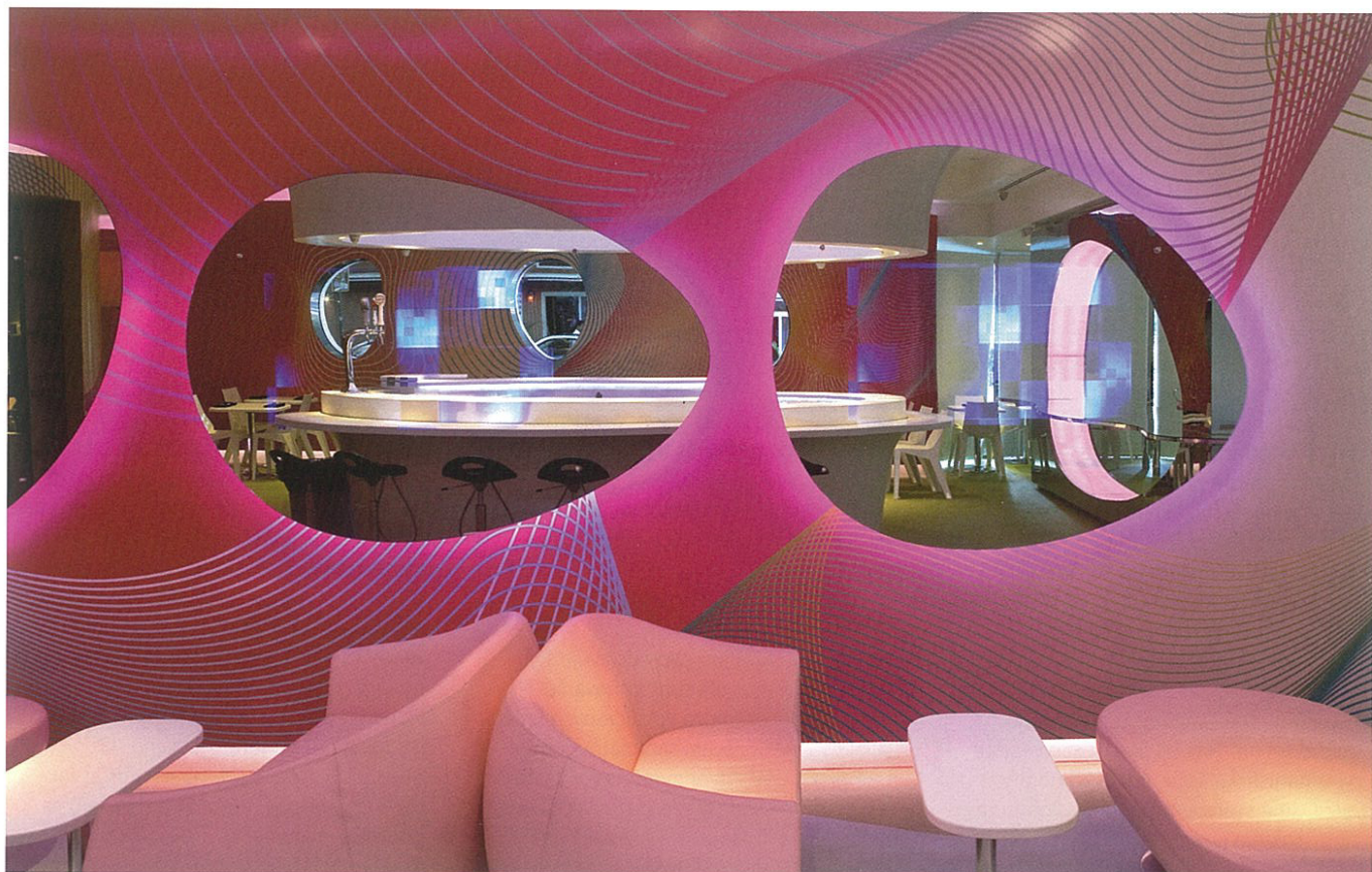
Kurve restaurant, New York

Priestory tejto reštaurácie ovládla krivka s rashidovským „k“. Usadila sa na oknách, stoloch, barovom či dídžejskom pulte. Na zákazku vytvorené tapety, prekypujúce Karimovými obľúbenými farbami – fuksiovou, fluoreskujúcou lipovou či žiarivou bielou, dodávajú stenám optické pôsobenie zastretých hraničných línií medzi grafickou prácou, umením a architektúrou.