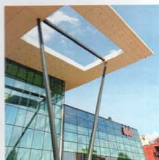
Aupark v Košiciach / Aupark in Košice