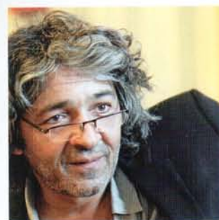
Rozhovor s architektom Rudym Ricciottim / Interview with Architect Rudy Ricciotti