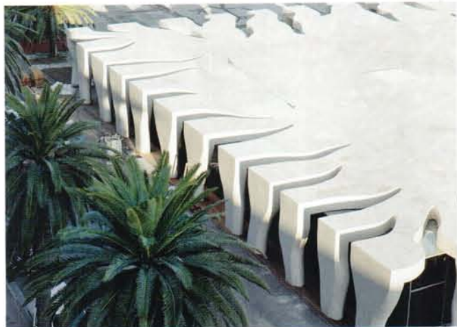
Jean Cocteau múzeum, Menton, Francúzsko