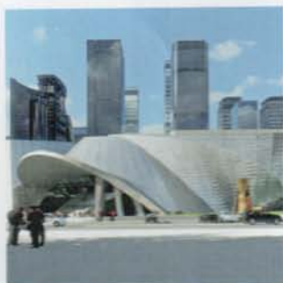
Projekt mesiaca: Coop Himmelb(l)au v Šenzene / Project of the Month: Coop Himmelb(l)au in Shenzhen