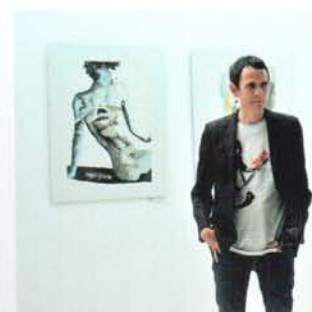
Dizajn: Finlay Cowan / Design: Finlay Cowan