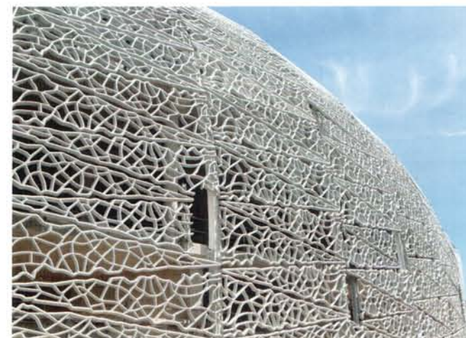
MUSEM – múzeum európskych a stredomorských civilizácií v Marseille

Rád by som zdôraznil, a nie je to žiadna novinka, že som bol jedným z prvých, ktorí sa zaoberali kontextuálnou otázkou. Teraz je to naozaj v móde, ale pred 15 rokmi všetci hovorili, že sa na kontext treba vykašľať. Moja odpoveď bola, že sú to imperialisti. Môžete ondieť seba, svoju priateľku, priateľa, ale prosím vás, nevyon-díte sa na kontext.