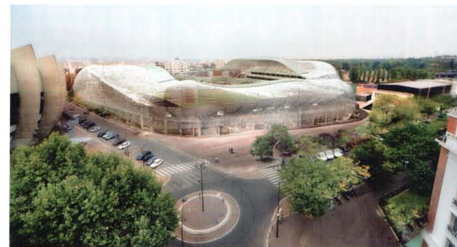
Jean Bouin Stadium, Paríž, dokončený bude na jar 2013