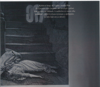
Kolekcia Mirry - IC Lights, vytváľa Flos. Keď používate žiarovku, alebo zariadenie s podobnou funkciou, ktoré sa pohybuje, dokonalé, že nachádzate tú správnu silu svetla, ktorá vám pomôže vyvolať a spracovať. Od toho bude som sa odvrátil.