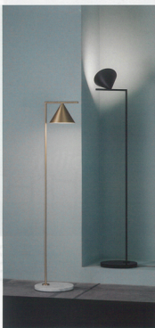
Otváka svetelná: pevnosť Lampa «Flos» charakterizuje dokonalú kompozíciu dvoch geometrických tvarov. Rôznymi veľkosti svetla prame alebo naprieme svetelnú.

MA: Zaujímam sa o dizajn ako taký celkovo, hoci svetlo ma vždy fascinovalo. S výrobou svietidiel som začal cieľne v súvislosti s otvorením vlastnej spoločnosti. Mo firma som sa potrieboval špecializovať. Nebola v mojich silách vytvoriť svetlo. To bolo hlavnou príčinou tohto zamerania. Práveintone navrhujem aj iné typy produktov, ale tie sú už špeciálne na objednávku zákaznika alebo pre moju vlastnú potrebu. Práve spolupráca s Flosom mi vytvorila preliezajú na práca s inými spoločnosťami,