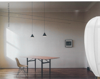
Systémové osvetlenie «String Lights», výrobca Flux: «Videl, keď vytváram riadok, fascináciou ma často obdierajúce radenia. To, ako poriadky spôsobujú jedinečné efekty, a zároveň riadky sú skutočným klenotom. Preto tento moment som chcel vyjadriť v architektonickej interieru.»