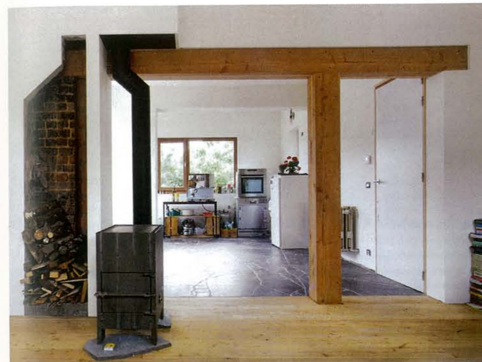
Dom OVO II, rekonštrukcia interiéru Foto: architecten de vylder vinck taillieu

Presne tak. Mohli by sme nosník schovať do stropu, zakapotovať ho. Ale chceli sme zdôrazniť, že na tom mieste bola kedysi stena, ktorej opornú funkciu sme teraz nahradili