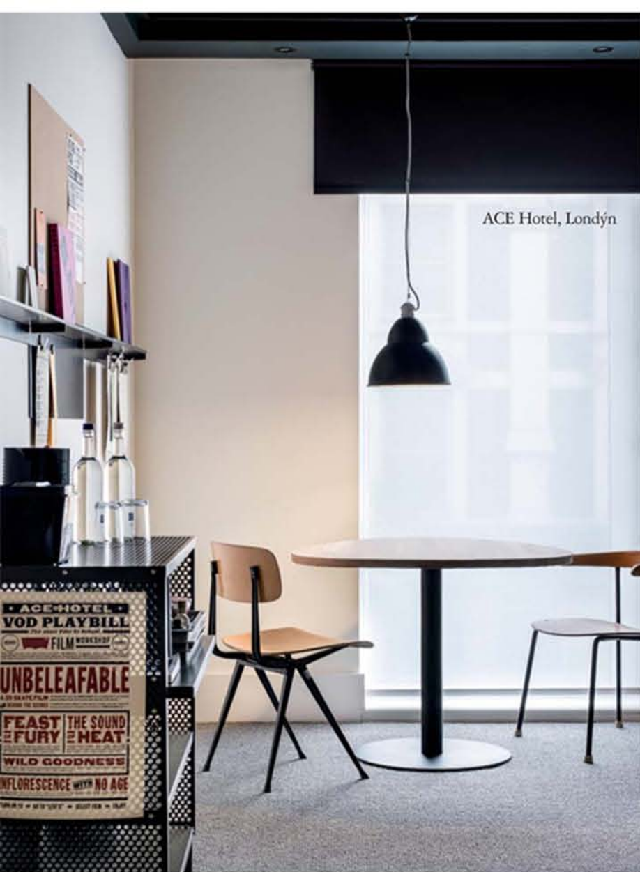
ACE Hotel, Londýn