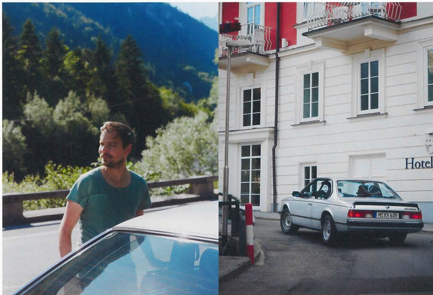
Životní cesta: Érou modelu 635CSi byla 80. léta 20. století, avšak i dnes si nenuceně poradí s horskými průsmyky, nerovnými cestami a prudkými zatáčkami.