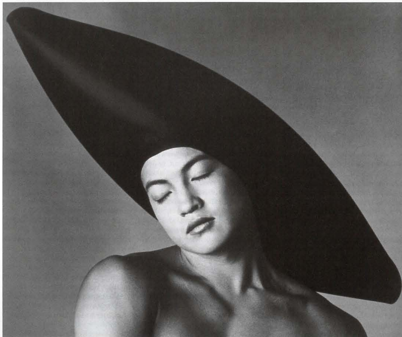
Kruhy – pokrývka hlavy, 1989.

Text Zuzana Šidliková